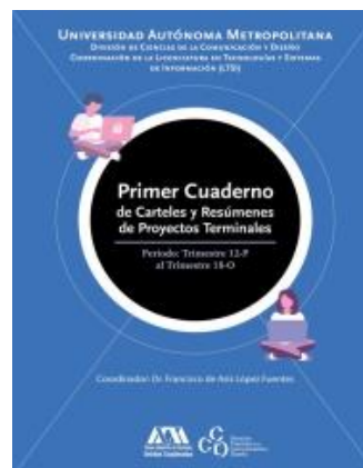
1er Cuaderno de carteles y resúmenes de proyectos terminales Francisco de Asís López Fuentes (coord)