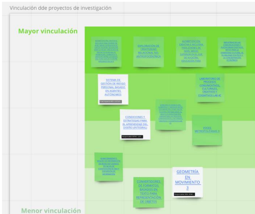
Fig.6 Identificación de posible relación entre el tema de Sustentabilidad y UEA de la Licenciatura en Diseño

Por otro lado, se realizó un registro de los proyectos de investigación desarrollados por los profesores investigadores pertenecientes al Departamento de Teoría y Procesos del Diseño, con el fin de identificar si las propuestas o temas de investigación pudieran estar vinculados con el tema general de Sustentabilidad.