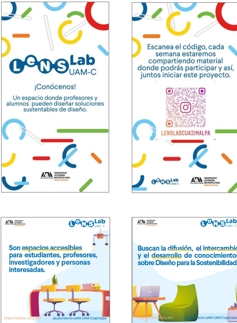
Fig.7 Material de difusión sobre el Laboratorio LeNS UAM Cuajimalpa y sus alcances

Si bien se encuentra en proceso la fase de entrevistas e identificación de necesidades y oportunidades sobre la participación en actividades relacionadas con el aprendizaje y enseñanza del Diseño para la Sustentabilidad, también se ha iniciado el desarrollo de primeras propuestas de difusión del Laboratorio LeNS UAM Cuajimalpa, con el fin de ir realizando un primer acercamiento e identificación de la red LeNS con la comunidad universitaria.