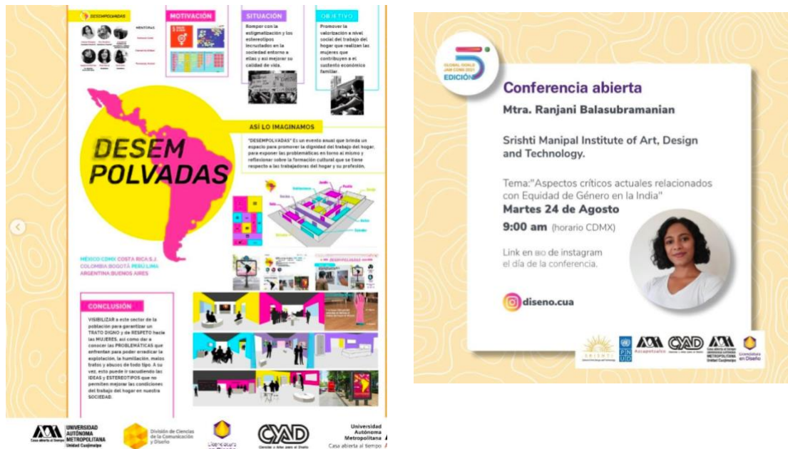
Fig.2 Difusión del evento Global Goals

De esta forma, se planearon y estructuraron 4 UEA de la Licenciatura de Diseño y de la Licenciatura en Estudios Socioterritoriales como parte de una propuesta alternativa a las UEA de movilidad Intra-Cuajimalpa, en la que se contemplaron contenidos que permitiera un aprendizaje interdisciplinario y colaborativo entre alumnos de dos licenciaturas para proponer soluciones de Diseño orientadas a la resolución de problemas vinculados con los Objetivos del Desarrollo Sustentable de la Organización de las Naciones Unidas.